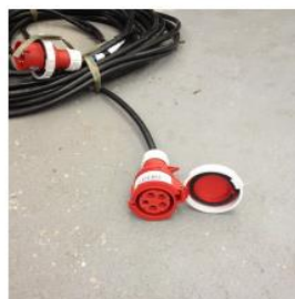
Ponta do cabo fornecido a partir de 01/01/2014

Visando a melhoria da segurança na execução das instalações elétricas e manter a conformidade com as normas vigentes, comunicamos que a partir de 01 de janeiro de 2014 os cabos de força utilizados para o fornecimento de energia elétrica aos estandes e demais necessidades dos eventos realizados nos pavilhões do Expo Center Norte terão em sua extremidade, onde o quadro de distribuição de força do estande é conectado, um Plugue Fêmea da marca PCE.