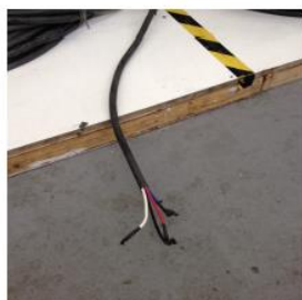
Ponta do cabo fornecido até 31/12/2013