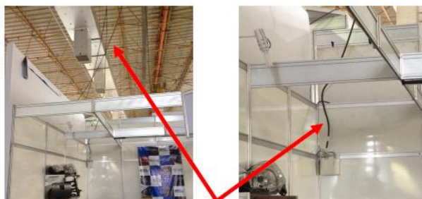
Cabo fornecido pelo EXPO Center Norte.