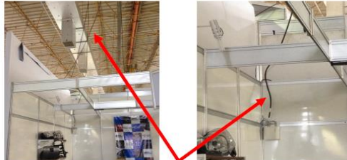
Cabo fornecido pelo EXPO Center Norte.