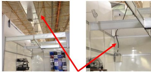
Cabo fornecido pelo EXPO Center Norte.