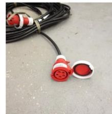
Ponta do cabo fornecido a partir de 01/01/2014