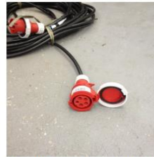
Ponta do cabo fornecido a partir de 01/01/2014