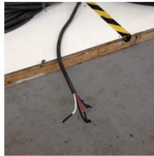
Ponta do cabo fornecido até 31/12/2013